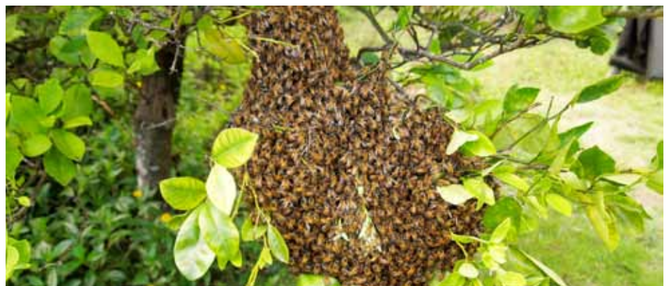
Ti pangen agtipon ti kayo bayat skaut nga uyukan agsarak ti naimbag nga baro balay.

Ti uyukan iti pangen kasapulan makasarak ti balay madagdaus ngem embes agtayab isu amin nga grupo, ti pagpapalutputen ti arubayan maileppas gapu agpaw-it ti nga skaut nga uyukan. Kalpasan ti pagen makaakar ti temporario nga pagyanan, agpaw-it ti sanggagasut nga skaut iti agsarak ti naibagay nga umok nga disso. Dagiti skaut nakem ipadamag iti grupo maipapan amin mabalin nga umok nga disso isuna pinalutpot, no isu nga abut ti uneg ti kayo, lugar ti nagbaetan ti balay, wenna uray binaybay-an baul nga kayo iti aragayan. Dagiti skaut nga uyukan imbaga da ti nasarakan diay daduma nga uyukan gapu agsala ken ag-uni. Ti pangen agdengdengeg da ti amin baro damage, ken kanayun nga skaut ti palobosan ti kapintasan nga disso. Ti panag-urnong ti damage ken pinagpili adino papanam awaten ti orgas aggapu sumagmamano dagiti manu nga aldawen, ngem kaaduan masansan ti pangen agakar idiy 24 oras da diay baru nga balay.