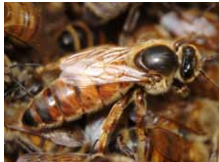
Dagiti reyna ti uyukan masansan sukatan kada tawen ken siguraduhin ti kolonia awan sakit ken adudan baru nga uyukan.

Dagiti apikultor maka-lapdan ti panagpangen gapu masakbayan ti